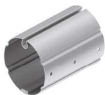
Barra de enrollado de Ø70 y 60