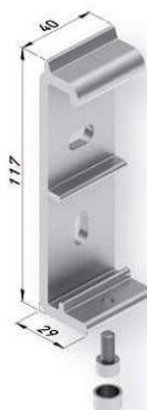
Soportes frontal techo (indicar en el pedido)