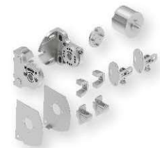
Kit soportes y fijación