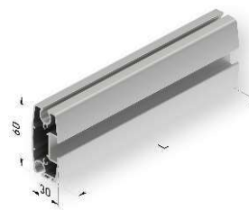
Barra de carga