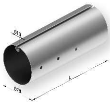
Barra de enrollado Ø78