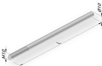
Varilla de 10 mm