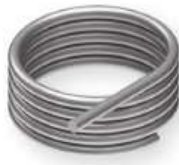
Cable de 3mm