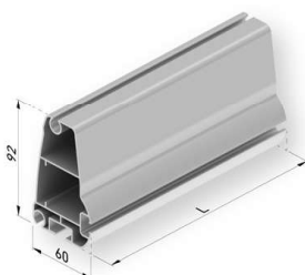
Barra de carga bambu 2