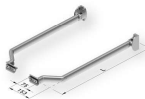
Jgo brazos sin tensión