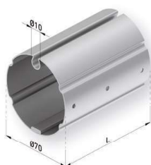
Barra de enrollle Ø70