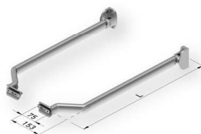
Jgo brazos con tensión