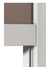
Barra de carga